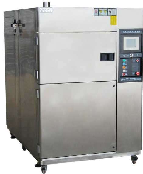
图片仅供参考，以实物为准

设备适用标准：GJB150.3-86、GJB150.4-86、GJB150.5-86、GB2423[1].02、GB2423[1].01 等